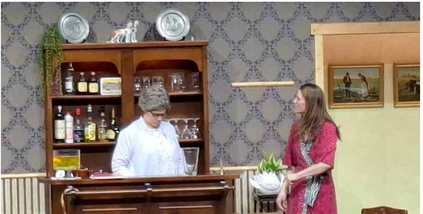
Theaterheldin Aagje: Humor en talent verzekerd in Martha en Mathilda in Zuienkerke.