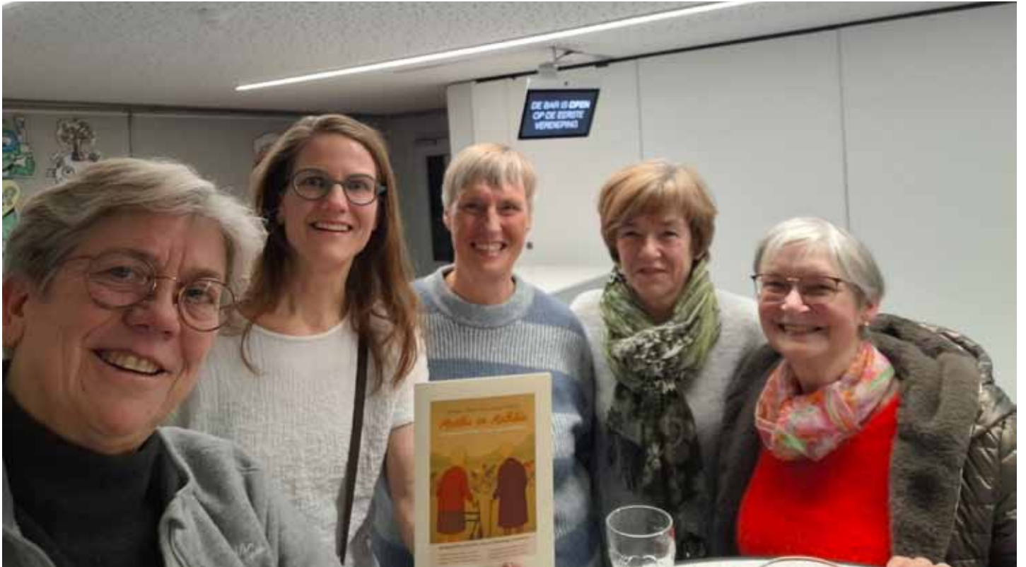
Samen op stap... maar nu met theaterglans! Ons Aagje schittert in Martha en Mathilda.